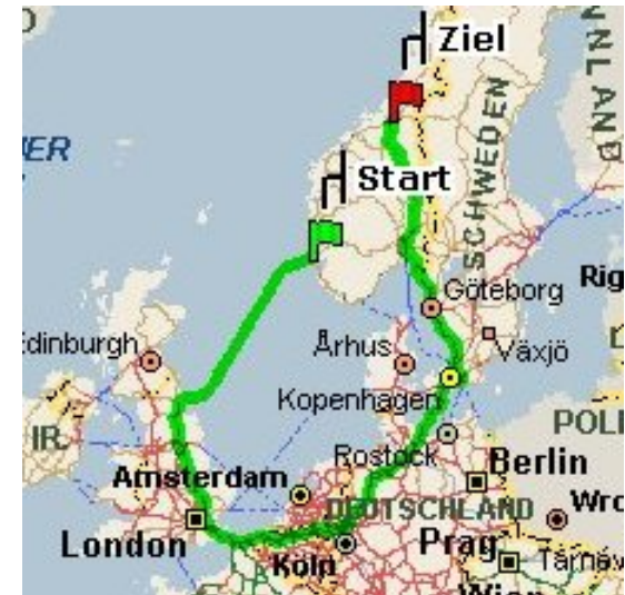
msn.com 2005: Haugesund → Trondheim