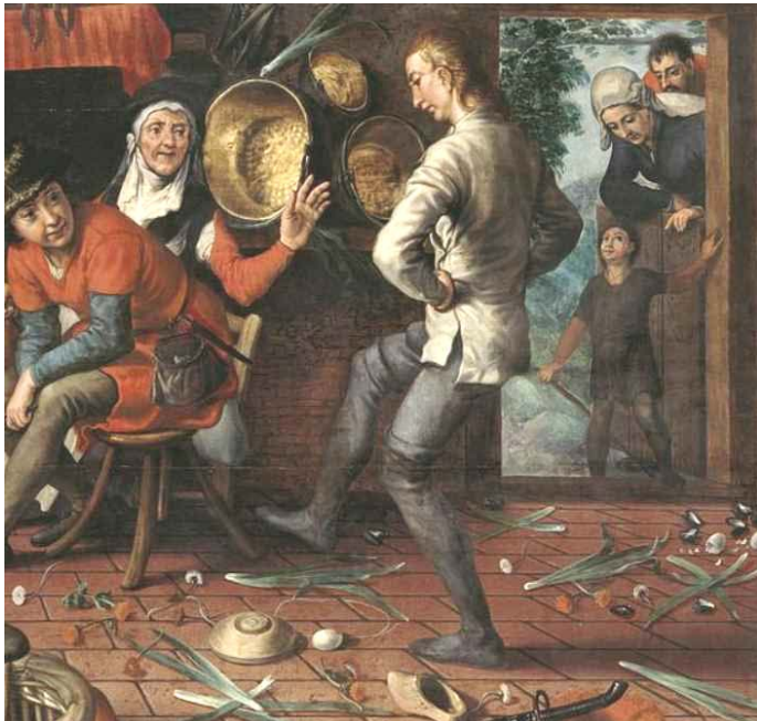
Pieter Aertsen: "Der Eiertanz ", 1552